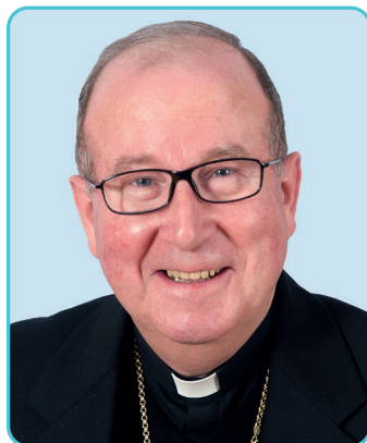
† José María Yanguas Sanz Obispo de Cuenca

Los grandes teólogos medievales estructuraron el conjunto de sus obras sobre el eje exitus-reditus , «salida-retorno». Contemplaron, así, todos los seres como criaturas que han salido de las manos a Dios y que vuelven a él empujadas por su misma naturaleza. También los seres humanos fuimos creados por Dios, redimidos por Jesucristo, para retornar a Dios movidos por nuestra misma naturaleza y, sobre todo, por la fuerza del Espíritu. Todo lo creado fue, pues, «llamado», «convocado» por Dios a la existencia, y todo es igualmente «llamado» para alcanzar en él su plenitud y realización última, según el modo propio de ser de cada criatura.